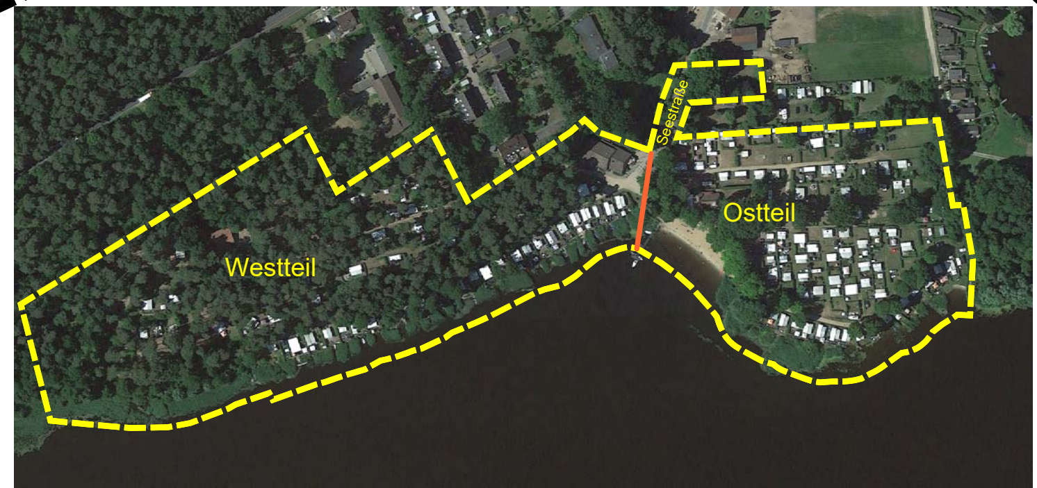
Bestandssituation im Luftbild (unmaßstäblich)