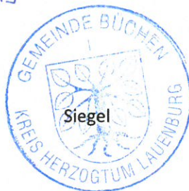
Uwe Möller Bürgermeister